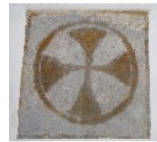
Weihekreuz im Altarraum