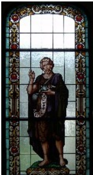
Eines der Buntglasfenster zeigt Johannes den Täufer mit seinem Hinweis auf Christus: „Siehe das Lamm Gottes“

Die neue Selbstständigkeit eröffnete der Kirche große Chancen. Die Kirche mußte lernen, daß sie sich nicht auf den Staat oder politische Mehrheiten verlassen darf, sondern allein auf ihren HERRN Jesus Christus und Sein Evangelium. Das 20. Jahrhundert brachte auch unserer Kirchgemeinde Herausforderungen und Kämpfe, in denen sich dieses Vertrauen auf Jesus bewähren mußte.