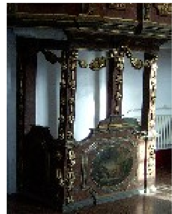
Der Beichtstuhl im Altarraum wurde auch nach der Reformation fleißig genutzt