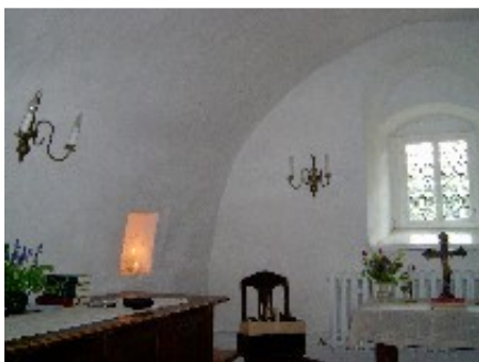
Tonnengewölbe der Sakristei mit Nische für Abendmahlsgeräte