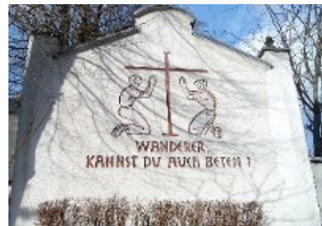
Die Inschrift an der Friedhofsmauer neben der B101

Nach dieser „Bulle“ wird unsere Kirche ab dem Jahre 1500 Wallfahrtskirche. Fünf Wallfahrtstage sind in ihr genannt: 1.) Der Sankt-Barbara-Tag am 4.Dezember; 2.) Der Tag der Reinigung Mariens (Lichtmeß) am 2. Februar; 3.) Der Tag der Geburt Mariens am 8. September; 4.) Allerheiligen am 1. November und 5.) Kirchweih. In einer Nachbemerkung aus späterer Zeit wird der Kirchweihtermin genannt: Am Sonntag vor St.Burkhard, d.h. am Sonntag vor dem 14.Oktober. Die Gläubigen, die an diesen Tagen eine Wallfahrt zu unserer Kirche unternahmen, die Gottesdienste besuchten, beichteten und Dankopfer gaben, erhielten von jedem Kardinal 100 Tage Ablass, d.h. ihnen wurden insgesamt 1200 Tage ihrer Strafzeit im Fegefeuer erlassen. Es wird berichtet, daß Pilger sogar aus Böhmen kamen. Unsere Kirche lag ja sehr verkehrsgünstig an wichtigen Handelsstraßen von Westen nach Osten, aber auch von Süden nach Norden, so führte z.B. ein Kirchsteig von Pöhla nach Markersbach, von dem heute noch Reste bekannt sind. Seit Jahrhunderten lädt eine Inschrift an unserer Friedhofsmauer zum Gebet in unserer Kirche ein. Man mag darin einen Nachklang an die Zeit der Wallfahrten erkennen. Ihre jetzige Gestalt stammt aus den fünfziger Jahren des 20. Jahrhunderts.