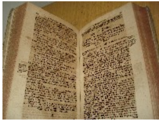
Die Bekenntnisschriften der lutherischen Kirche wollen eine Auslegung der Heiligen Schrift sein.

Aus dem Bericht Lehmanns wird deutlich, daß der Bauernkrieg eine Entladung des Volkszorns war und sich auch gegen die Kirche richtete, die durch ihren Umgang mit dem Geld unglaublich geworden war. Allerdings waren die Bauern nicht zimperlich und raubten auch gleich die Nachbarn mit aus. Nebenbei bemerkt Lehrmann, daß Raschau 1525 noch keinen eigenen Pfarrer hatte.