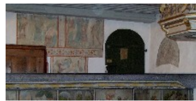
Mittelalterliche Fresken an der Westseite