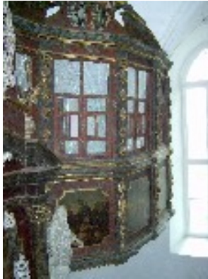
Nun den Engeln vorbehalten

Jesu. Sie wird als Erfüllung der alttestamentlichen Geschichte von der ehernen Schlange angesehen, wie es im Johannes-Evangelium geschrieben steht: „Wie Moses in der Wüste die Schlange erhöht hat, so muß der Menschensohn erhöht werden, damit alle, die an ihn glauben, das ewige Leben haben.“ Ganz oben schwebt ein Engel, der ein Spruchband hält, auf dem ein Bibelwort aus dem 1. Petrusbrief steht: „Die Engel gelüftet es zu schauen.“ Dieser Engel veranschaulicht die Tatsache, daß die Engel unsichtbar bei uns sind, wenn wir Gottesdienst feiern. So wird auch heutzutage die Empore im Altarraum nicht mehr von Menschen besetzt, sondern bleibt den Engeln vorbehalten.