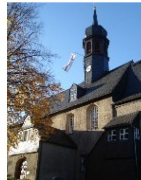
Haupteingang auf der Südseite der Kirche

Die erwähnte Sankt-Peter-und-Pauls-Kirche ist unsere jetzige Sankt-Barbara-Kirche. Kirchenbauliche Untersuchungen haben gezeigt, daß unsere St.Peter-und-