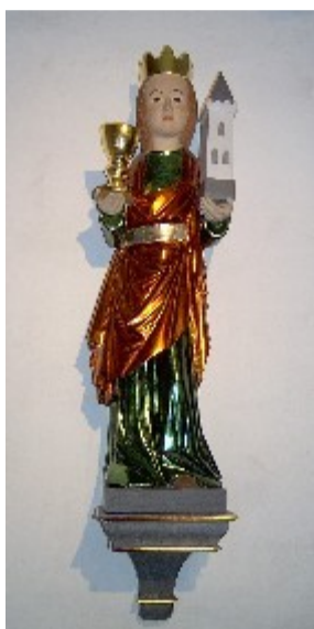
Die neue St.Barbara

Da Markersbach an einer wichtigen Verkehrsverbindung nach Böhmen lag, werden auch hier Hussiten durchgezogen sein. Der Mönch Feiner berichtet von einer Sankt-Michaelis-Kapelle bei Markersbach, die 1429 von den Hussiten zerstört worden ist. Archäologische Untersuchungen haben gezeigt, daß auch die Kirche in Grünstädtel von Hussiten zerstört worden ist. Wahrscheinlich haben die Hussiten auch unsere Kirche entweiht. Für diese Vermutung spricht die Tatsache, daß es aus der Zeit vor 1430 kein bewegliches Inventar (Bilder, Kelche, Glocken etc.) mehr gibt. Alles, was nicht niet und nagelfest war, werden die Hussiten geplündert oder zerstört haben. So wird auch unsere Kirche um 1430 neu geweiht sein müssen. Noch heute sieht man ein Weihekreuz im Altarraum. Bei dieser neuen Weihe hat unsere Kirche dann den Namen Sankt