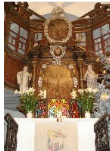
Der Hauptaltar mit der Empore der Hammerherren

Die Bautätigkeit um 1660 zeigt, daß sich die Gemeinde von den Folgen des Dreißigjährigen Krieges inzwischen gut erholt hatte. Dieser Krieg wütete schrecklich im Oberen Erzgebirge. Der Erzgebirgskamm war seit der Reformation nicht nur eine Staatsgrenze, sondern auch eine Konfessionsgrenze zwischen dem evangelischen Sachsen und dem katholischen Böhmen. So war das Erzgebirge ein ständiges Durchmarschgebiet der feindlichen Heere. Je länger der Krieg dauerte, desto schlimmer wüteten die Soldaten. Dabei gab es nicht einmal einen Unterschied, ob es sich um feindliche oder verbündete Truppen, um katholische oder evangelische handelte, die Grausamkeit war unvorstellbar. Christian Lehmann berichtet darüber in seiner Kriegschronik aus eigener Erfahrung. Aus Furcht vor Mord und Vergewaltigung flohen die Einwohner der Dörfer in die Wälder und mußten manchmal wochenlang dort ausharren. Durch den Krieg kamen Glaubensflüchtlinge aus Böhmen ins sächsische Erzgebirge. Ein solcher Exulant wurde 1628 in Markersbach Pfarrer: Adam Mylius.