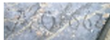
Inscription auf der Empore

1660 wurde unter Pfarrer Gottfried Petzold das Dach der Kirche erneuert. Seither hat die Kirche einen neuen Turm, eine sog. barocke Haube. Die Kirche wurde nach hinten verlängert und bekam große Fenster. Da es noch kein Treppenhaus gab, diente ein hölzerner sog. Steigturm im Westen dazu, auf die oberen Emporen zu gelangen. Die obere Empore ist ja auch erst 1662