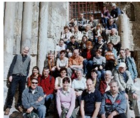
Pilgergruppe unserer Kirchgemeinde im Februar 2006 vor

In der christlichen Kirche lebt dieser Brauch fort. Christen pilgern zu den Orten, an denen Jesus gewirkt hat: In Bethlehem wurde deshalb dort, wo die Krippe einst stand, die Geburtskirche und in Jerusalem die Grabeskirche auf dem Berg Golgatha gebaut. Aber auch die Gräber der Apostel und Märtyrer waren den Christen heilig. Über ihnen wurden Kirchen gebaut. Besonders an den Todestagen der Märtyrer pilgerte man in diese Kirchen. Denn der Todestag ist der Tag des Eingangs in den Himmel.