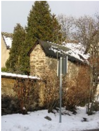
Teil der Friedhofsmauer

Pauls-Kirche bereits eine stattliche Kirche war: Die Mauern des heutigen Kirchenschiffs stammen zum großen Teil von 1250. Unsere jetzige Kirche weist eine Reihe von Kennzeichen des romanischen Baustils auf, der um 1250 für Dorfkirchen noch bestimmend war: