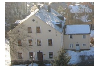
Das Pfarrhaus zu Markersbach

Manche Fürsten haben sich auch sehr um die Kirche bemüht. Dennoch entspricht die enge Verbindung von weltlicher und kirchlicher Macht nicht dem Evangelium. Diese enge Verbindung von Thron und Altar (Staat und Kirche) wurde durch die Folgen des Ersten Weltkrieges beendet.